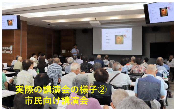
実際の講演会の様子② 市民向け講演会