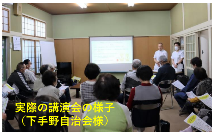
実際の講演会の様子 （下手野自治会様）