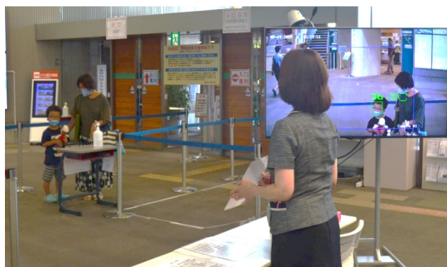
来院者全員の体温測定と問診